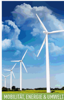
MOBILITÄT, ENERGIE &amp; UMWELT