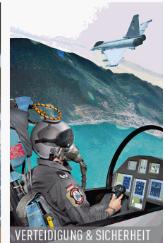
VERTEIDIGUNG &amp; SICHERHEIT

Wir sind eine eng vernetzte Unternehmensgruppe und bieten integrierte zukunftsorientierte Lösungen in den Branchen Automotive • InfoKom • Mobilität, Energie & Umwelt • Luftfahrt • Raumfahrt • Verteidigung & Sicherheit. Wir verstehen die Anforderungen unserer Kunden. Wir beraten unabhängig und kompetent. Wir realisieren effektiv, effizient und zielgerichtet. Wir betreiben zuverlässig und nachhaltig. Unsere internationale Marktpräsenz und unser Erfolg basieren auf technologischer Spitzenkompetenz und einem fairen Verhältnis zu unseren Kunden und Geschäftspartnern.